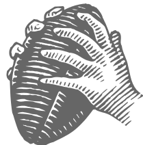
◀迷惑ラグビー倶楽部 全員集合